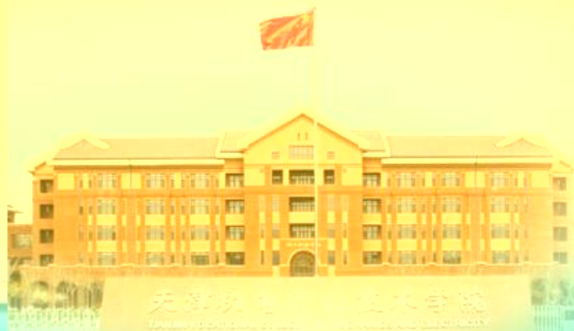
天津职业技术师范大学